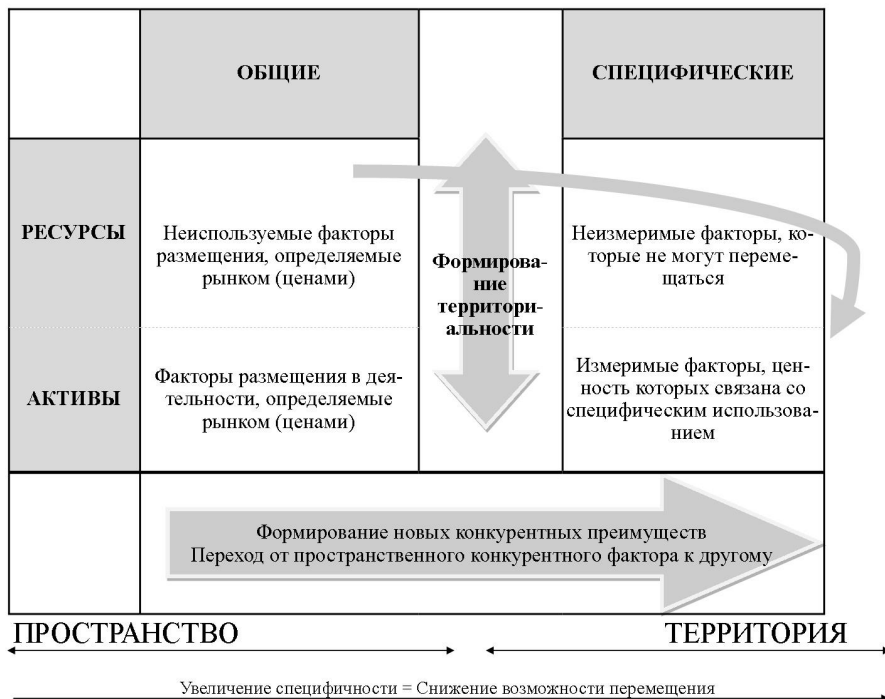
Рис. 1. Типология конкурентных преимуществ региона

Важнейшую роль в обеспечении конкурентоспособности региона играют институциональные факторы, которые могут быть как экзогенными, так и эндогенными. Если изменение значения фактора является «прямым следствием решений и действий субъектов экономической политики на уровне соответствующего региона», то его следует относить к эндогенным факторам, в противном случае — к экзогенным [24, с. 24]. Социально-экономическая политика региональных властей, реализуемая ими в рамках стратегии развития региона, — значимый эндогенный институциональный фактор конкурентоспособности.